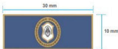
CA-1 Distintivo curso de ascenso del grado de Oficial Principal al de Subcomisario/a