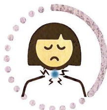
Dolor de garganta